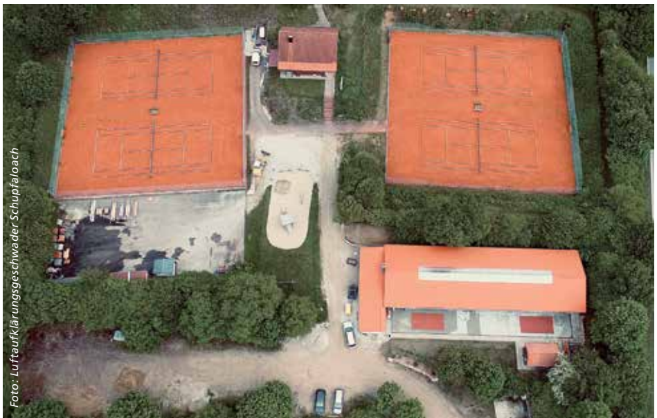
Foto: Luftaufnahme von der Schupflosach