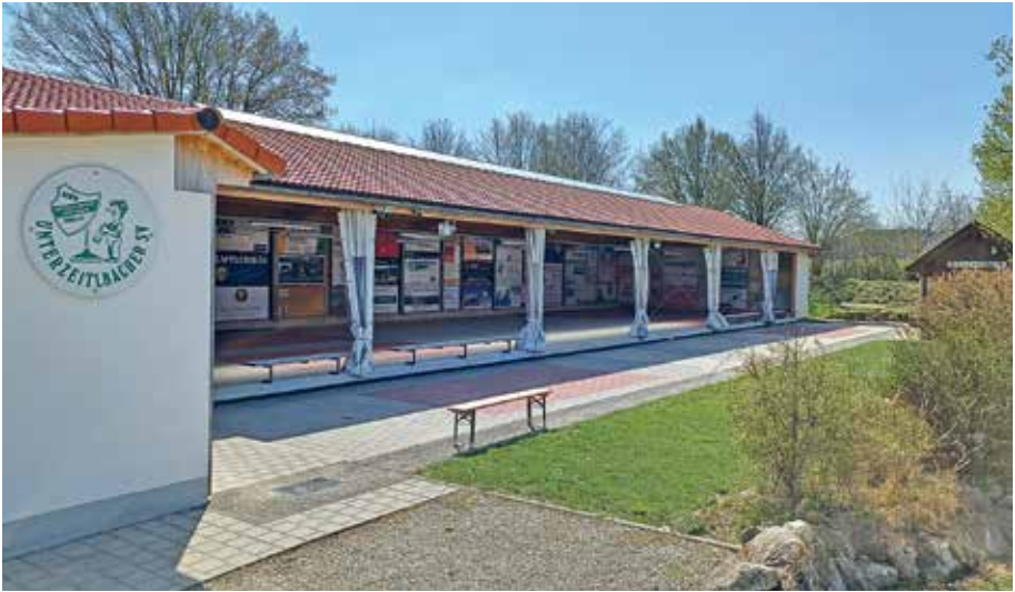
Die 3-Bahnen-Stockanlage an der regelmäßig dienstags und freitags ab 19:00 Uhr und in den Wintermonaten anstatt freitags samstags ab 13:00 Uhr Stockschießen stattfindet.

Verfügung. Im Namen der ganzen Stockschützen bedanken wir uns bei Pauli recht herzlich für seinen Einsatz für den Verein und die Stocksparte. Zu neuen Stockwarten wurden Sepp Effinger als 2. Stockwart und Klaus Ludwig als 1. Stockwart gewählt.