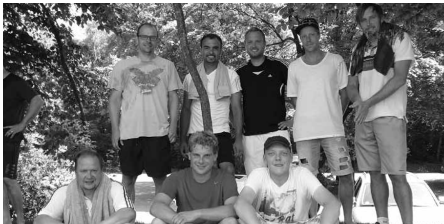
Die erfolgreiche Mannschaft nach dem entscheidenden Spiel in Dachau