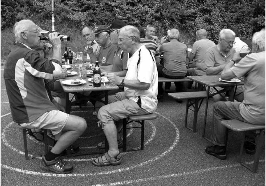
Gut essen und trinken...