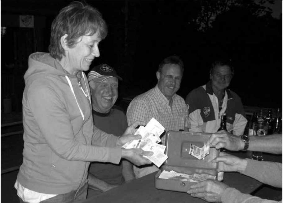
... und a Gaudi wurde schon immer groß geschrieben bei den „Zeitlbeck'a Stockschützen“